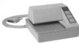
Impresor Epson y Botones de Control